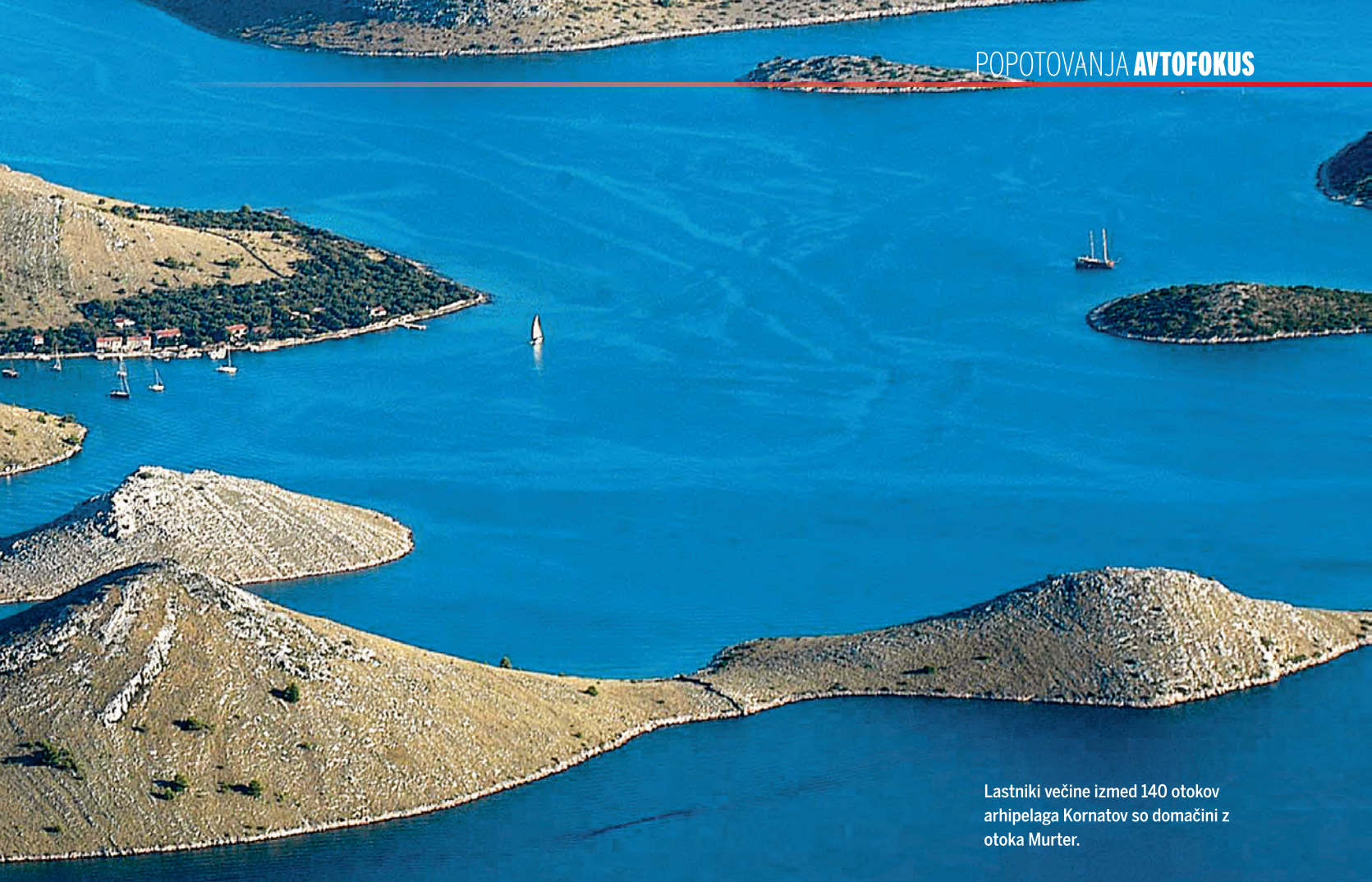
Lastniki večine izmed 140 otokov arhipelaga Kornatov so domačini z otoka Murter.