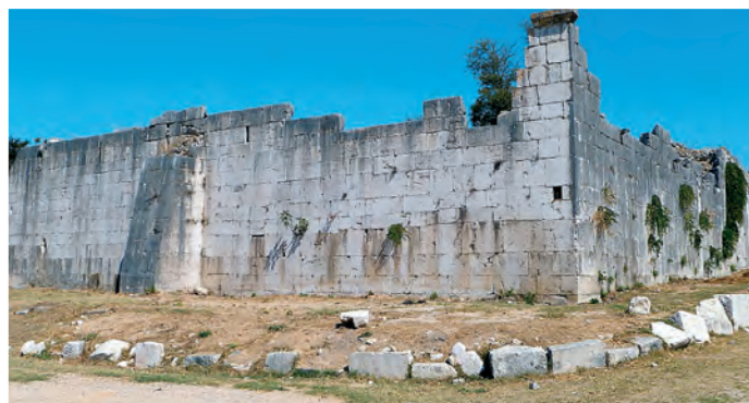
Menda najbolj zahodna turška utrjena postojanka Maškovića Han je na ogled v pozabljenem kraju Vrana.