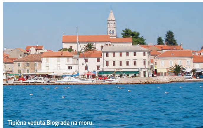
Tipična veduta Biograda na moru.

okrog Pašmana na Murtersko morje, prek katerega priplujejo v območje narodnega parka Kornati. Arhipelag Kornati sicer sestavlja 140 neposeljenih otočkov, toda le 89 jih leži znotraj meja narodnega parka. Ožine med otočki v kombinaciji z vetrovi so zanimive jadralcem, bogato morsko dno pa potapljačem, seveda le na devetih območjih, kjer je to početje dovoljeno. Ostali na Kornatih predvsem fotografirajo, se sprehajajo po geologom zanimivem površju ali pa si privoščijo morsko kosilo v eni od približno dvajsetih restavracij.