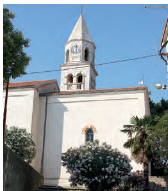
Največja izmed mnogih biograjskih cerkva je župnijska cerkev Sv. Štosije.

Med nekdanjimi vladarji Biograda so bili tudi vranski templjarji. Vrana, danes pozabljen kraj v zaledju Vranskega jezera, je bil v srednjem veku pomembna postojanka templjarjev, katerih utrdbo si lahko ogledamo, prav tako kot najbolj zahodni turški karavanseraj Maškovića Han. V teh krajih so se namreč bile najhujše bitke med Benečani in Turki, ki so menda svoje-