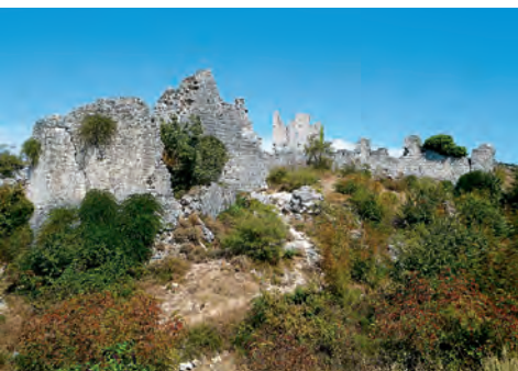
Le redkokje v Evropi si lahko ogledamo ostanke templjarskega hrama, kakršen je stal v Vrani.