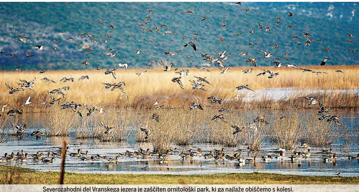
Severozahodni del Vranskega jezera je zaščiten ornitološki park, ki ga najlaže obiščemo s kolesi.