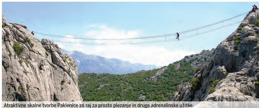
Atraktivne skalne tvorbe Paklenice so raj za prosto plezanje in druge adrenalinske užitke.