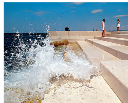
Morske orgle so najbolj unikatna znamenitost Zadra, kljub njegovi izjemno bogati zgodovinski ponudbi.