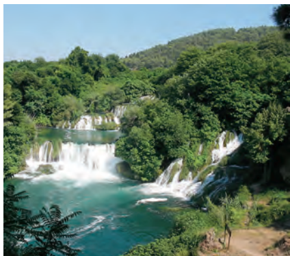
V poletni vročini je kopanje v tolmunih Krke pravi užitek.

Stari del Biograda leži na ovalnem polotoku in se spogleduje s Pašmanom, najbolj zelenim hrvaškim otokom, ki ga od celine ločuje Pašmanski kanal, posejan s številnimi otočki, povezuje pa ga ladijska linija iz največje biograjske marine Kornati.