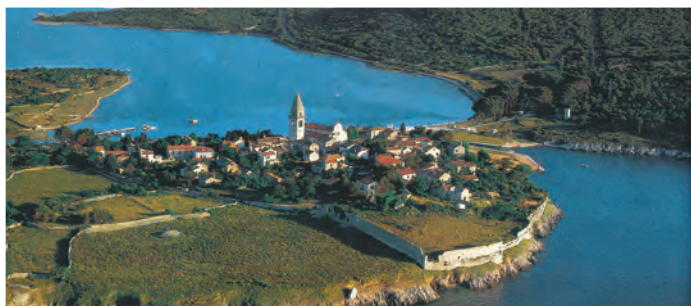
Otoka Cres in Lošinj povezuje pomični most čez pičlih 11 metrov široki Osorski kanal.