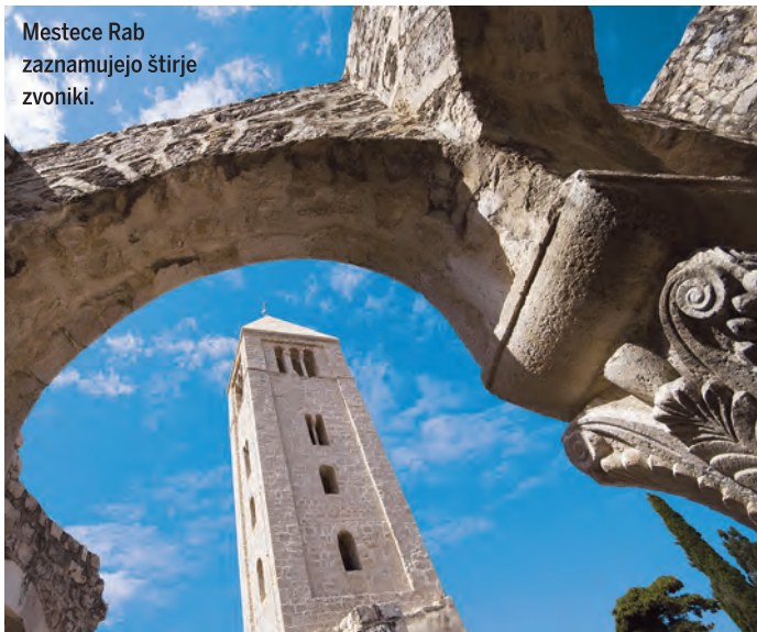
Mestece Rab zaznamujejo štirje zvoniki.

Na gozdnatem severu Cresa se lahko podamo na najvišja vrhova Gorico ali Sis, kjer nas bodo zagotovo preletavali beloglavi jastrebi, ki gnezdiijo v tem ornitološkem parku,