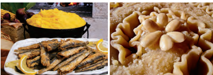
Utrinek primorske kuhinje: fige, kruh izpod peke, polenta v kotličku in sardele. Slatno rapsko torto zlahka najdemo tudi v trgovinah s spominki na Rabu.