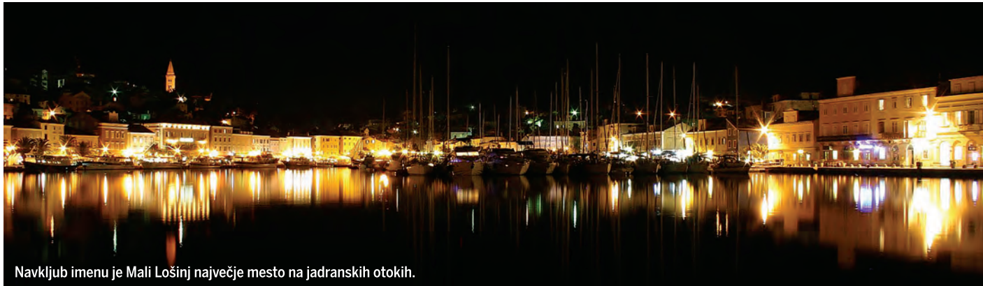
Navkljub imenu je Mali Lošinj največje mesto na jadranskih otokih.

na zasluženno okrepčilo pa se spustimo v slikoviti Beli na visoki polici nad morjem. Ali pa na zahodno stran otoka, v štiri tisočletja stare Lubenice, ki z vrha pečine nudijo veličasten razgled, 387 metrov niže pa eno najlepših prodnatih plaž v Kvarnerju. Ob obali – v mestu Cres ali v ribiški vasi Valun – je prva priložnost za kulinarična doživetja.