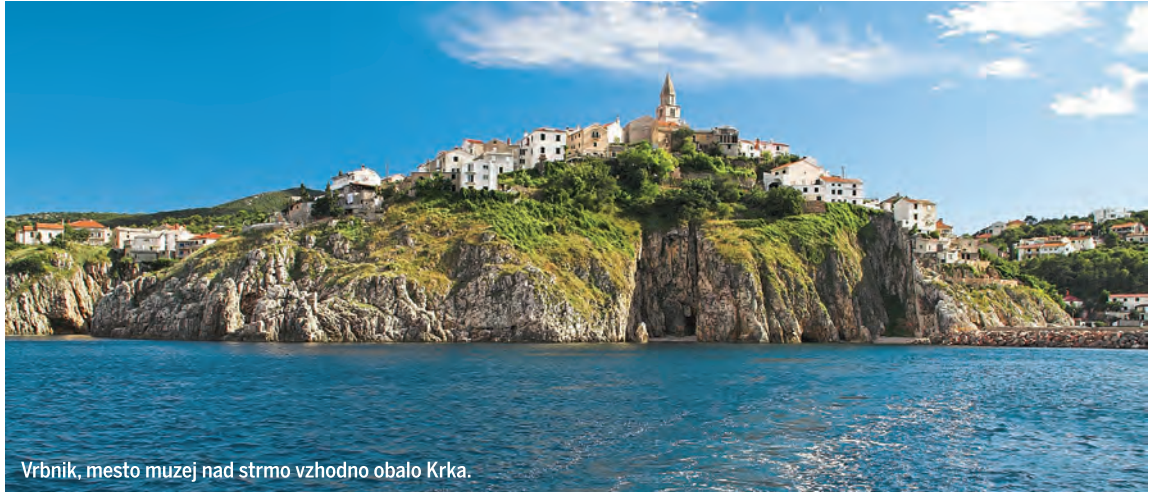
Vrbnik, mesto muzej nad strmo vzhodno obalo Krka.