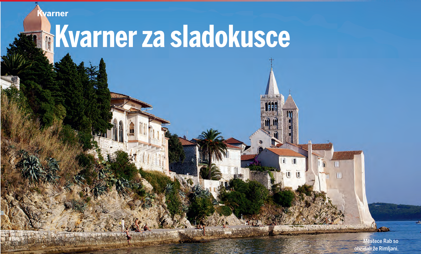
Mestece Rab so obzidali že Rimljani.