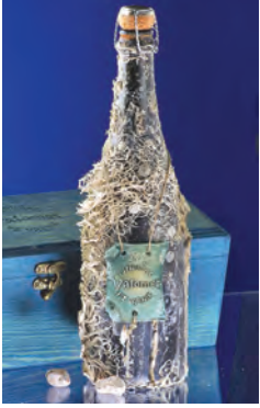
Vrbniška penina Valomet zori 30 metrov pod morjem, steklenice pa so naravne umetnine koral in školjk.